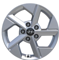
16" kola z lehké slitiny