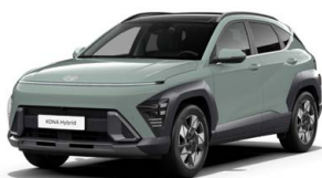
Mirage Green Pastelová Kombinace dostupná také s černým lakováním střechy Cena: 0 Kč