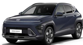
Denim Blue Pearl Perleťová Kombinace dostupná také s černým lakováním střechy Cena: 17 900 Kč