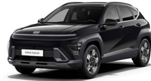
Abyss Black Pearl Perleťová Cena: 17 900 Kč