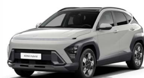
Cyber Gray Metallic Metalická Kombinace dostupná také s černým lakováním střechy Cena: 17 900 Kč