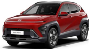
Ultimate Red Metallic Metalická Kombinace dostupná také s černým lakováním střechy Cena: 17 900 Kč