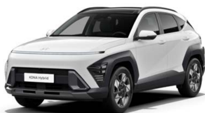
Serenity White Pearl Perleťová Kombinace dostupná také s černým lakováním střechy Cena: 17 900 Kč